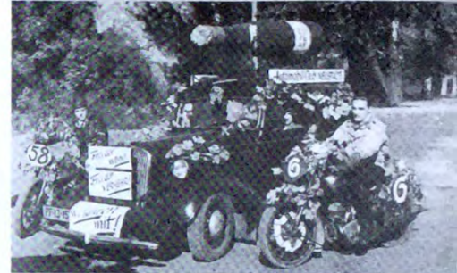
Der ACN beim ersten Weinfestzug nach dem Krieg 1948